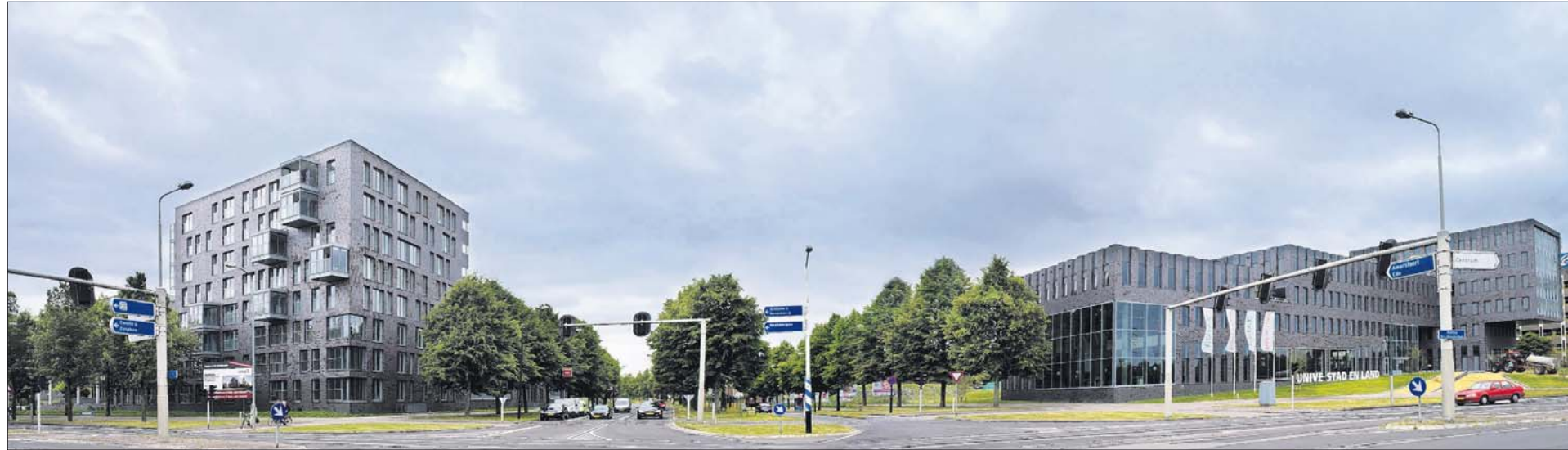
Het appartementengebouw De Stadhouderslaan (links) en het hoofdkantoor van Univé (rechts) vormen samen een nieuwe stadspoort naar het centrum van Apeldoorn.

De deurbel heeft de vorm van een metalen schijf. Je draait eraan en de namen en huisnummers van de bewoners verschijnen op een beeldscherm. Even drukken en de bel gaat over. Tegelijk neemt het paneel een foto van je, zodat de bewoner ook als hij niet thuis is, kan nagaan wie er voor hem of haar aan de deur is geweest. Het is een van de vele luxe details van appartementengebouw De Stadhouderslaan. Wie van de drukke Koning Stadhouderslaan de hal van het hoofdkantoor instapt, ziet meteen het centrale thema van de vier woongebouwen met samen negentig appartementen: ruimte, ruimte en nog eens ruimte. Omhoog, omdat