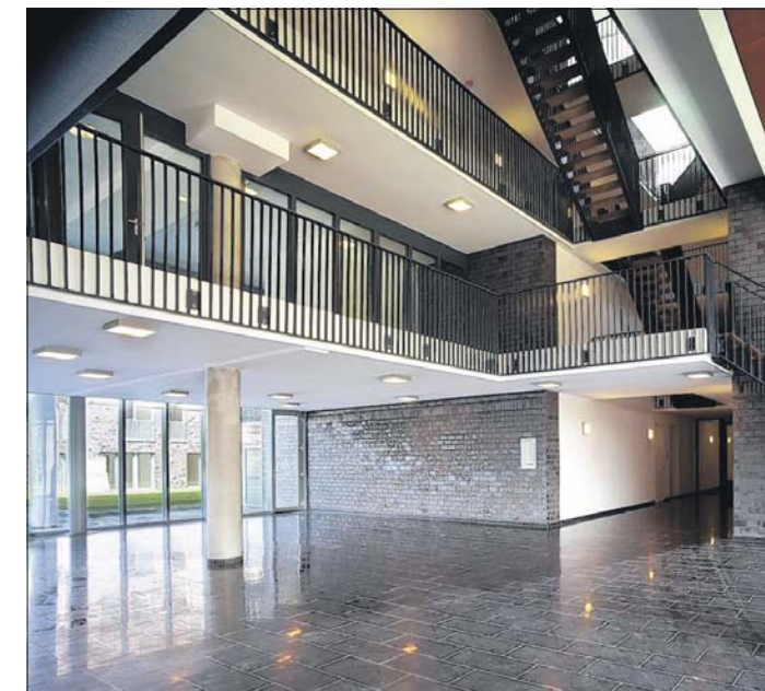
Blik in de hal van appartementengebouw De Stadhouderslaan.

Binnen is dezelfde grote ruimte te ervaren als in de appartementengebouwen. „Hier hebben we nauwelijks pilaren toegepast, zodat je het gevoel hebt in een hele grote ruimte te zijn. Bovendien is het kantoor dan vrij in te delen. Nooit staat er een pilaar in de weg. Met een restaurant met dakterras en een directeurskamer met patio heeft Rijnbout net als in het appartementengebouw de binnenruimtes van flinke buitenruimtes voorzien. „Als de directeur gasten heeft, kan hij buiten gaan zitten”. Voor de gevels heeft hij kleinere stenen gebruikt dan bij de appartementengebouwen. Ook de kleur verschilt iets. De gebouwen zijn daardoor duidelijk familie van elkaar, maar elk gebouw heeft ook zijn eigen identiteit. Van saaiheid is daarom geen sprake.