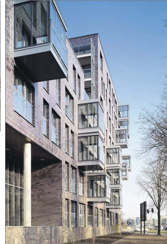
Balkons in een onregelmatig ritme aan de Koning Stadhouderslaan.

worden gekeken of er in de parkeergarage nog bezoekersplaatsen vrij zijn en in de toekomst mogelijk boodschappen te bestellen zijn. Daarnaast is er nauwelijks een appartement hetzelfde. Op negentig appartementen zijn er 43 types, met een vloeroppervlak tussen de 80 en 140 vierkante meter. Rijnbout zegt die afwisseling belangrijk te vinden. „We ontwerpen geen buitenkant om een rijtje appartementen die allemaal hetzelfde zijn. We besteden juist heel veel aandacht aan de indeling van de woningen, want de kwaliteit van een project zit toch vooral in hoe de bewoner het gebouw ervaart. We vinden het juist leuk om aan gewone woningplattegronden te ontsnappen”.